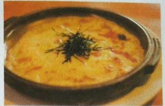
とろろ芋のチーズ焼き