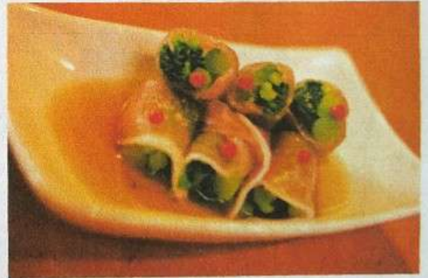
明日葉の生ハム巻き