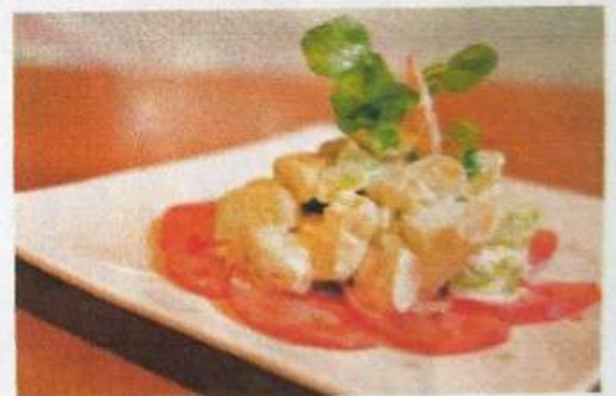
エビとアボカドのサラダ