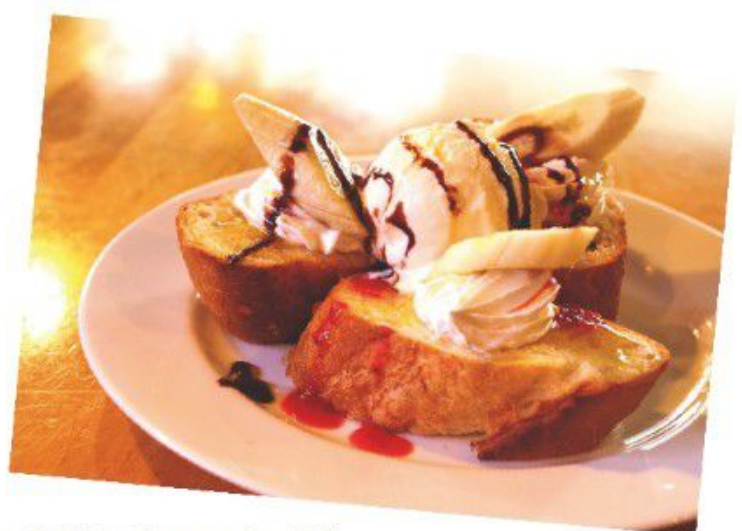
スペシャルハニートースト